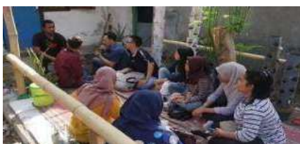
Gambar 1. Survei tempat