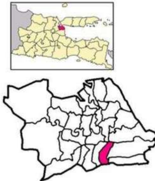
Gambar 1 : Peta Lokasi Kegiatan KKN Kendangsari

( https://surabayakota.bps.go.id/publication/2018/09/26/0efa86b30353592562b94172/kecamatan-tenggilismejoyo-dalamangka-2018.html ). Yang di tunjukkan pada gambar 1.