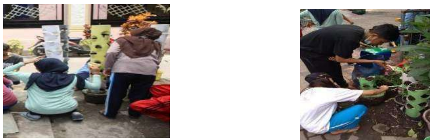
Gambar 4. Pembibitan sayur