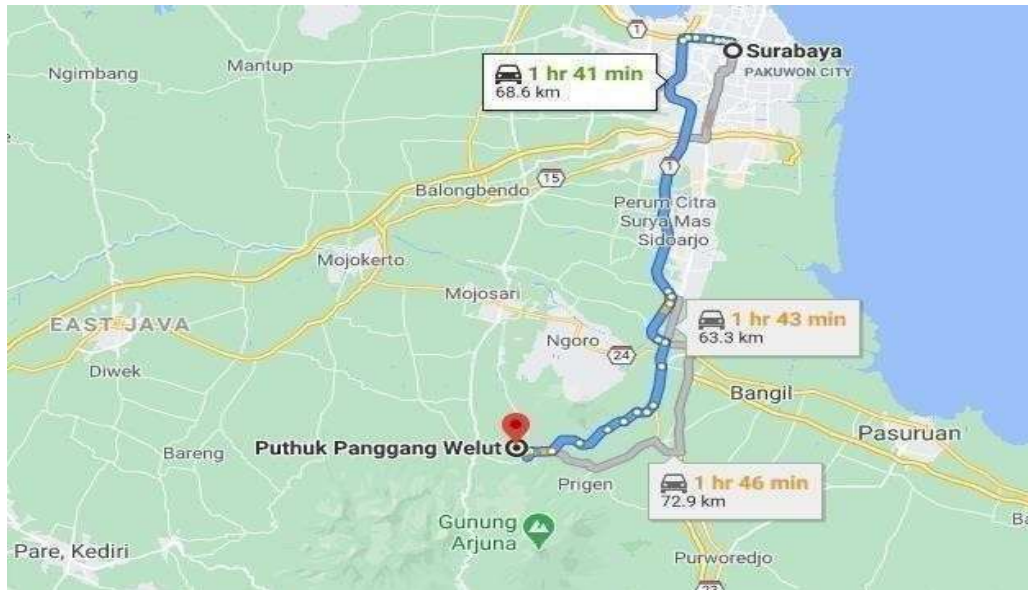
Gambar 1. Peta Wilayah Desa Nogosari Wisata Puthuk Panggang Welut

Gambar 1 menunjukkan peta wilayah Desa Nogosari Wisata Puthuk Panggang Welut