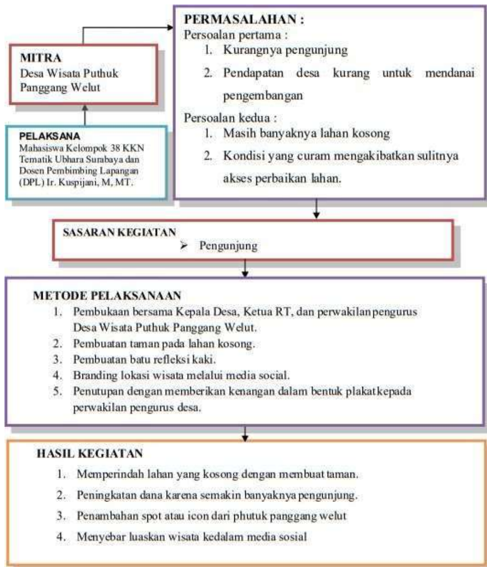
Gambar 2. Bagan alur implementasi kegiatan KKN Tematik Kelompok 038

Sebelum kegiatan dilakukan, terlebih dahulu menyampaikan maksud dan tujuan kedatangan pelaksana KKN pembuatan taman beserta pembuatan refleksi batu yang menghasilkan branding lokasi, yang dibuka dengan bantuan pengurus desa, dilanjutkan dengan penyampaian materi sketsa pembuatan taman. Evaluasi akhir kegiatan dilaksanakan dengan memperlihatkan hasil taman kepada perwakilan pengurus desa dengan tujuan untuk mengetahui kekurangan dari kegiatan tersebut, dan meningkatkan kepedulian pengunjung sebelum dan sesudah adanya penambahan spot taman. Evaluasi kegiatan berdasarkan hasil kegiatan dari pembuatan taman diharapkan mampu menambah keindahan dari lokasi wisata. Gambar 2 menunjukkan bagan alir implementasi kegiatan KKN Tematik Kelompok 038.