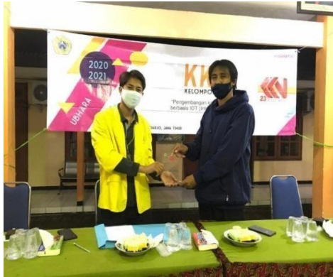
Gambar 10. Penyerahan vendel sebagai