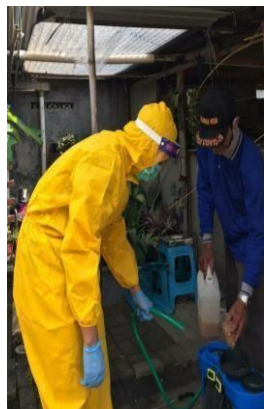
Gambar 16. Pengisian cairan disinfektan