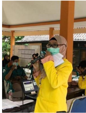
Gambar 6. Sosialisasi E-commerce