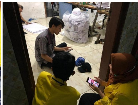
Gambar 9. Praktek penggunaan E-commerce pada UMKM Topidan Tas