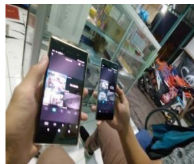
Gambar 15. Pemantauan CCTV dari Handphone