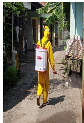
Gambar 17. Penyemprotan disinfektan