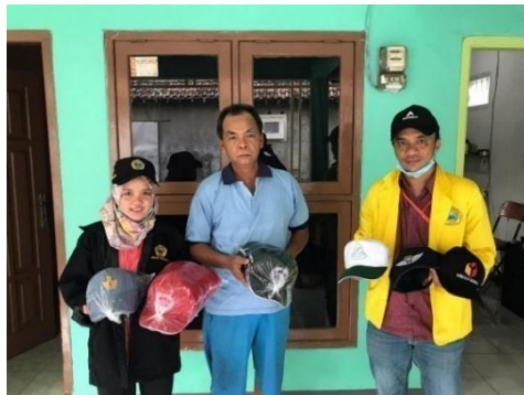
Gambar 4. UMKM Topi Desa Punggul