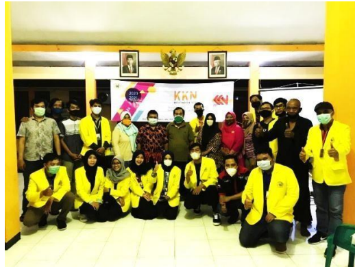
Gambar 11. Penutupan Kenang-kenangan