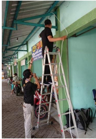
Gambar 12. Penyambungan kabel Untuk pemasangan CCTV