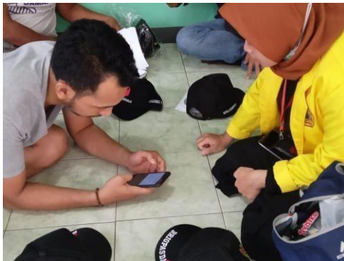
Gambar 8. Praktek penggunaan E-commerce Pada UMKM topi