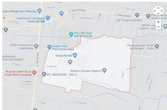
Gambar 1. Peta Desa Punggul

Desa Punggul adalah sebuah desa di wilayah Kecamatan Gedangan, Kabupaten Sidoarjo, Provinsi Jawa Timur. Desa ini berbatasan dengan Desa Ketajen dan Desa Wedi di Utara, Desa Gemuruh di timur, Desa Rebel dan Desa Kragan di selatan serta Desa Seruni di barat.