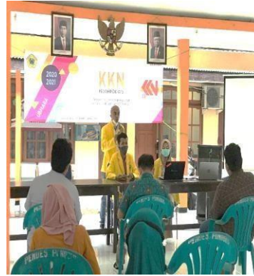
Gambar 7. Sosialisasi E-commerce dari aspek hukum