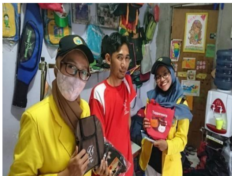
Gambar 5. UMKM Tas Desa Punggul