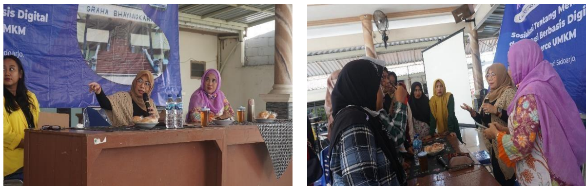
Gambar 2. Sosialisasi UMKM

Kegiatan ini dilaksanakan pada hari Sabtu Tanggal 13 Mei 2023 yang bertempat di Balai Desa Gisik Cemandi yang di hadiri oleh ibu ibu pkk desa Gisik Cemandi. Kegiatan ini kami adakan karena kurangnya kesadaran masyarakat tentang digitalisasi dalam pemasaran produk UMKM dan kurangnya pengelolaan terhadap hasil sumber daya alam yang dimiliki desa tersebut dan perlu diadakannya sosialisasi kepada masyarakat tentang potensi pemasaran online yang saat ini sedang berkembang pesat. Sosialisasi UMKM ini bertema “Sosialisasi Tentang Merk dan Aplikasi Berbasis Digitalis Untuk E-Commerce Bagi Pelaku UMKM” kita juga mendatangkan pemateri untuk menyampaikan beberapa materi mengenai E- Commerce