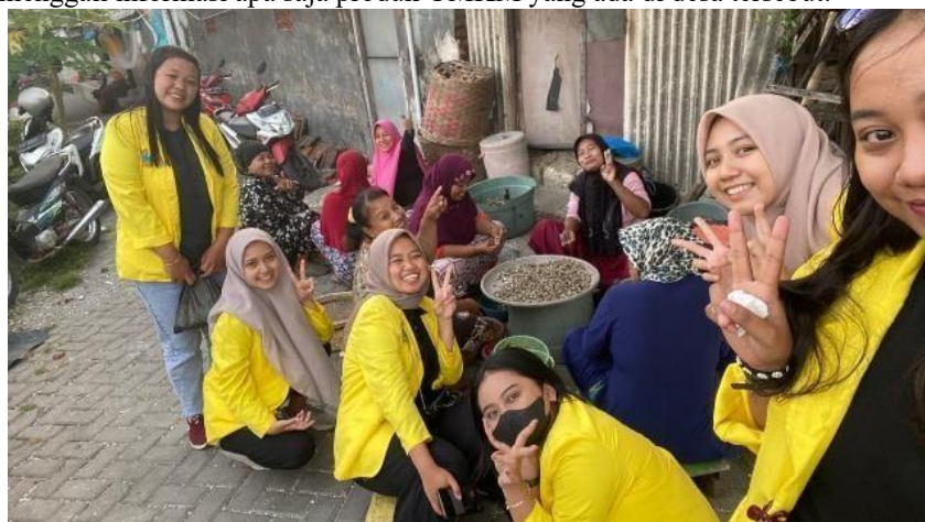
Gambar 3. Kunjungan UMKM

Kegiatan ini dilaksanakan pada hari Sabtu Tanggal 13 Mei 2023 yang bertempat di Desa Gisik Cemandi, program kerja utama kelompok kami yaitu Sosialisasi UMKM dan sebelum memulai sosialisasi tahap awal kelompok kami adalah berkunjung ke tempat produksi UMKM yang ada di desa tersebut. Kunjungan UMKM ini bertujuan untuk menggali informasi apa saja produk UMKM yang ada di desa tersebut.