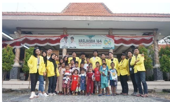
Gambar 5. Kegiatan Lomba