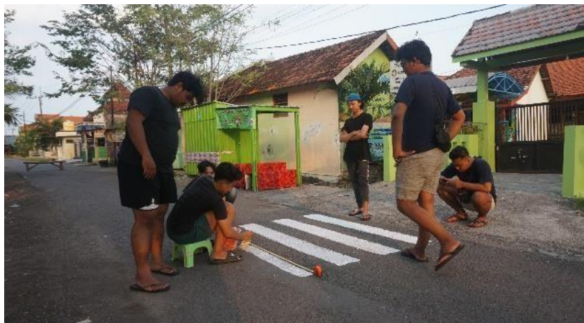
Gambar 4. Pembuatan Zebra Cross

Kegiatan ini dilaksanakan pada hari Sabtu Tanggal 13 Mei yang bertempat di depan SD Gisik Cemandi, sebelumnya di area sekolah tidak ada Zebra Cross yang dimana kita ketahui Zebra Cross sangat penting bagi pengguna jalan