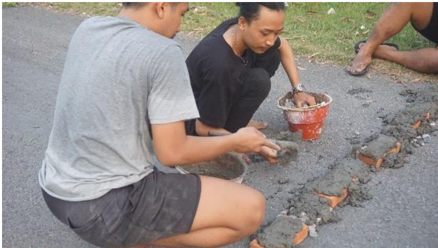
Gambar 7. Kegiatan Pembuatan Polisi Tidur

Pada hari Minggu Tanggal 21 Mei yang bertempat di sekitar area Sekolah Dasar kami mengadakan kegiatan pembuatan polisi tidur. Saat kelompok kami melakukan survey di desa tersebut dimana di area Sekolah Dasar ini tidak ada polisi tidur yang dimana polisi tidur ini sangat berguna agar para warga yang melintasi jalan tersebut dapat lebih berhati-hati.