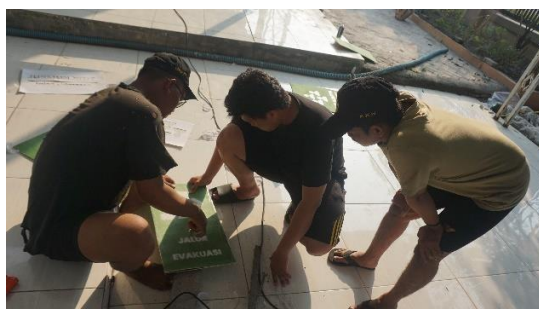
Gambar 6. Kegiatan Pembuatan Plakat

Pada hari Sabtu Tanggal 20 Mei yang berlokasi di Balai Desa kami melaksanakan kegiatan pembuatan plakat tujuan dari kegiatan ini untuk memberi informasi kepada Masyarakat sekitar. Kelompok kami membuat beberapa macam plakat diantaranya yaitu Plakat titik kumpul dan Plakat jalur evakuasi dan memiliki fungsi masing masing.