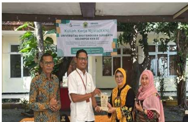
Gambar 7. Penutupan kegiatan KKN