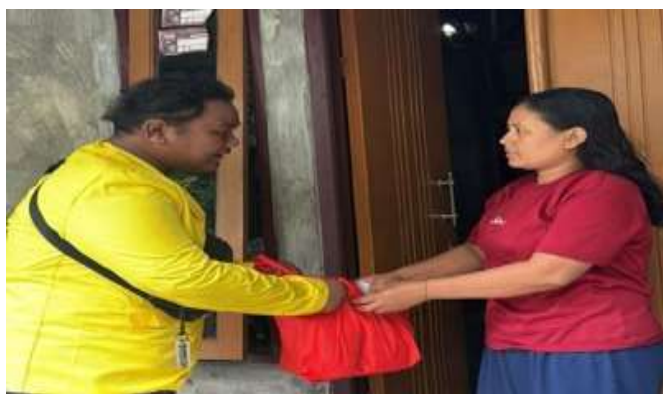
Gambar 6. Kunjungan pada warga

Kegiatan berikutnya adalah melaksanakan konsultasi dan kunjungan kepada masyarakat secara door to door dengan mengumpulkan ketua RW yang selanjutnya di sampaikan kembali kepada ketua RT dan di teruskan kepada warga Kelurahan dalam bentuk silaturahmi/sambang warga. Konsultasi dibuka kepada masyarakat guna menanamkan pentingnya menjaga keamanan ketertiban dan perizinan bangunan di wilayah Kelurahan Jambangan. Menanyakan kembali secara langsung kepada warga adanya dampak kamtibmas serta penerapan IMB. Pola komunikasi ini ternyata sangat bermanfaat bagi masyarakat agar dapat saling mengingatkan dan penyampaian kepada sesama warga untuk tanggap darurat terutama menghadapi kejadian yang meresahkan seperti pencurian dan pembegalan kendaraan milik warga. Dan dalam kegiatan ini pula kami sampaikan solusinya yaitu dengan mendirikan Poskamling dengan pembagian jaga pos yang di sepakati warga untuk menjaga keamanan warga.