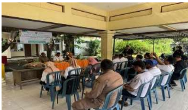
Gambar 5. Penyuluhan dengan warga dalam forum konsultasi

Kegiatan berikutnya adalah melaksanakan konsultasi dan kunjungan kepada masyarakat secara door to door dengan mengumpulkan ketua RW yang selanjutnya di sampaikan kembali kepada ketua RT dan di teruskan kepada warga Kelurahan dalam bentuk silaturahmi/sambang warga. Konsultasi dibuka kepada masyarakat guna menanamkan pentingnya menjaga keamanan ketertiban dan perizinan bangunan di wilayah Kelurahan Jambangan. Menanyakan kembali secara langsung kepada warga adanya dampak kamtibmas serta penerapan IMB. Pola komunikasi ini ternyata sangat bermanfaat bagi masyarakat agar dapat saling mengingatkan dan penyampaian kepada sesama warga untuk tanggap darurat terutama menghadapi kejadian yang meresahkan seperti pencurian dan pembegalan kendaraan milik warga. Dan dalam kegiatan ini pula kami sampaikan solusinya yaitu dengan mendirikan Poskamling dengan pembagian jaga pos yang di sepakati warga untuk menjaga keamanan warga.