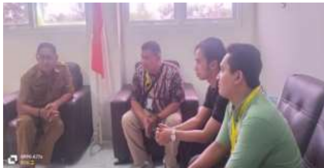
Gambar 4. Koordinasi dengan Babinkamtibmas dalam merumuskan tahapan sosialisasi kamtibmas