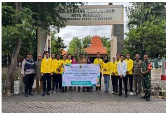
Gambar 1. Penyelarasan Visi Misi Kelurahan Jambangan dengan Program KKN

Pada kegiatan pengabdian ini kami melakukan dengan cara berinteraksi secara langsung pada perwakilan masyarakat sehingga dapat memberikan manfaat nyata dan dibagikan kepada warga sekitar sebagai pilot project yang nantinya akan bisa diteruskan oleh warga ke warga yang lainnya. Selain juga diadakan penyuluhan dan edukasi mengenai komunikasi pentingnya untuk meningkatkan keamanan dan ketertiban serta perijinan bangunan sehingga warga kelurahan Jambangan dapat menjaga dan membuat masyarakat memanfaatkan hasil penyuluhan yang kami sampaikan.