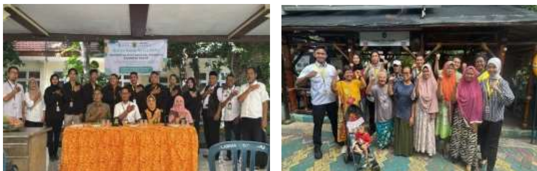
Gambar 2. Dukungan Aparat Kelurahan dan Warga

Program Pengabdian Kepada Masyarakat dalam bentuk KKN yang kami laksanakan dengan tema “Optimalisasi Mewujudkan Lingkungan yang Aman dan Tertib pada Masyarakat Kelurahan Jambangan” bertujuan untuk membantu meningkatkan kesadaran masyarakat dalam pemeliharaan keamanan dan ketertiban masyarakat dan kepatuhan dalam perijinan mendirikan bangunan di Kelurahan Jambangan, Kecamatan Jambangan, Kota Surabaya. Kegiatan ini mendapat dukungan dari aparat kelurahan dan warga masyarakat sebagaimana tercermin dalam gambar berikut :