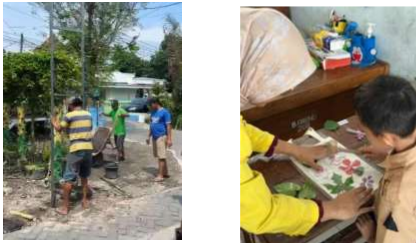
Gambar 4.3 Pemasangan kerangka dan edukasi ecoprint

positif dalam kehidupan sosial. Kegiatan ini menegaskan peran pemuda sebagai agen perubahan dalam pembangunan desa. Temuan ini sejalan dengan Alhadar et al. (2022) yang menekankan pentingnya partisipasi pemuda dalam transformasi pembangunan desa berbasis kearifan lokal.