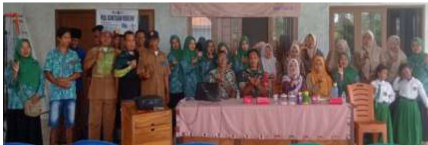
Keterangan: Kegiatan Penyuluhan Sebagai Tindak Lanjut Dari Pembinaan Remaja

Sebagai desa binaan maka hasil kegiatan Pengabdian kepada Masyarakat terus dipantau dan didampingi dengan memadukan pendekatan partisipatif mampu meningkatkan pengetahuan, sikap, dan partisipasi remaja dalam mencegah kenakalan remaja. Kegiatan ini tidak hanya memberikan dampak pada individu remaja, tetapi juga memperkuat kesadaran dan peran masyarakat desa secara keseluruhan. Hasil kegiatan ini diharapkan dapat menjadi dasar pengembangan program pemberdayaan remaja yang lebih terstruktur dan berkelanjutan di Desa Kalisat. Dengan sinergi antara remaja, masyarakat, dan pemerintah desa, upaya pencegahan kenakalan remaja dapat dilakukan secara efektif demi terciptanya lingkungan sosial yang aman, tertib, dan sejahtera.