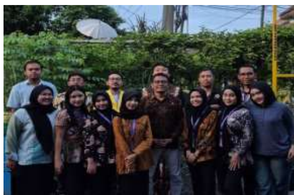
Gambar 4.4 Foto Bersama di kebun markisa

Secara keseluruhan, hasil pelaksanaan KKN Tematik di Desa Kwangsan menunjukkan bahwa program pemberdayaan berbasis potensi lokal mampu memberikan dampak multidimensional, baik pada aspek lingkungan, ekonomi, pendidikan, maupun sosial. Keberhasilan program tidak terlepas dari keterlibatan aktif masyarakat, dukungan perangkat desa, serta peran mahasiswa sebagai fasilitator dan pendamping. Tingginya partisipasi warga menjadi indikator keberhasilan program sekaligus modal sosial bagi keberlanjutan kegiatan setelah KKN berakhir. Temuan ini memperkuat pendapat Nurafifah (2025) bahwa pemberdayaan desa yang berbasis potensi lokal dan partisipasi masyarakat merupakan strategi efektif dalam mendorong pengembangan desa diarahkan untuk menjadi kampung wisata yang berbasis potensi lokal guna meningkatkan perekonomian masyarakat. Melalui penataan lingkungan kampung yang asri, pemanfaatan tanaman markisa, kelor, buah-buahan, dan sayuran, serta penguatan peran masyarakat dalam pengelolaan potensi tersebut, desa diharapkan mampu menarik minat wisatawan. Pengembangan kampung wisata ini tidak hanya bertujuan meningkatkan pendapatan warga melalui sektor pariwisata dan UMKM, tetapi juga mendorong terciptanya lapangan kerja, kemandirian ekonomi, serta kesadaran masyarakat dalam menjaga lingkungan dan melestarikan potensi lokal secara berkelanjutan.