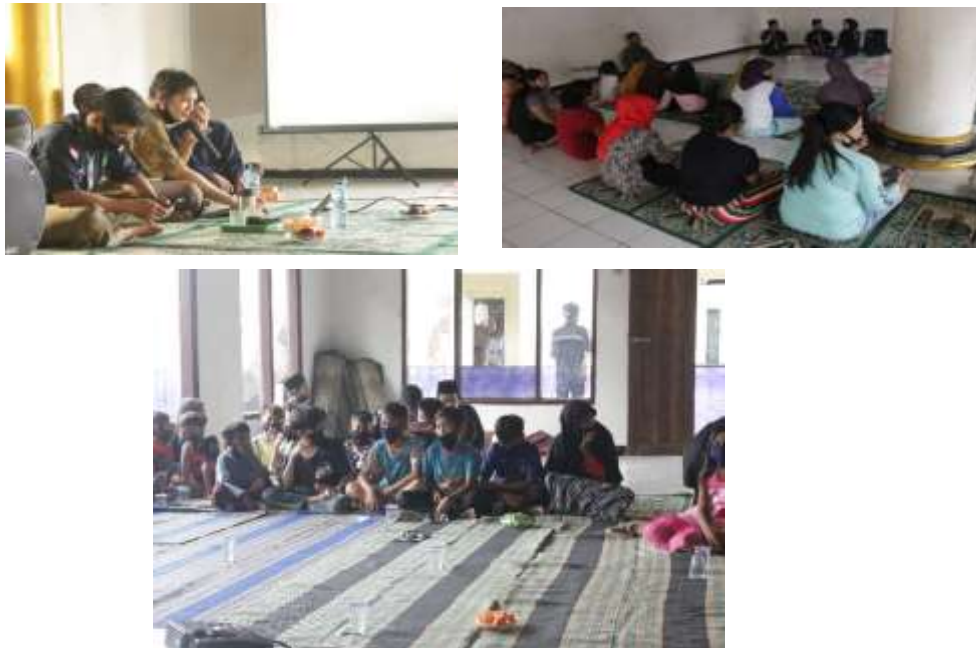
Gambar 1. Pelaksanaan Pengabdian Masyarakat Kampung Ciranjeun, Desa Pasir Limus, Kecamatan Pamarayan, Kabupaten Serang, Provinsi Banten