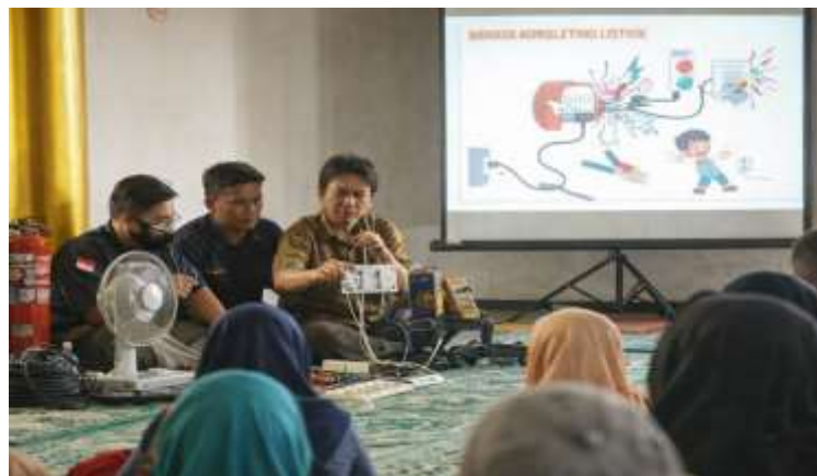
Gambar 2. Pelaksanaan kegiatan sosialisasi Penggunaan Peralatan Listrik dan Bahaya Konsleting Listrik di Kampung Ciranjieun, Desa Pasir Limus, Kecamatan Pamarayan, Kabupaten Serang, Banten. Kegiatan dilakukan melalui penyampaian materi dan demonstrasi alat peraga instalasi listrik sebagai upaya meningkatkan pemahaman masyarakat mengenai keselamatan penggunaan listrik rumah tangga dan pencegahan kebakaran akibat konsleting listrik.

Selain itu, kegiatan ini juga berkontribusi pada peningkatan kapasitas sumber daya manusia di tingkat lokal, khususnya dalam aspek keselamatan dan kemandirian masyarakat dalam mengelola risiko di lingkungan tempat tinggalnya. Dengan meningkatnya pengetahuan dan kesadaran terhadap bahaya konsleting listrik, masyarakat diharapkan mampu melakukan tindakan pencegahan secara mandiri dan berkelanjutan.