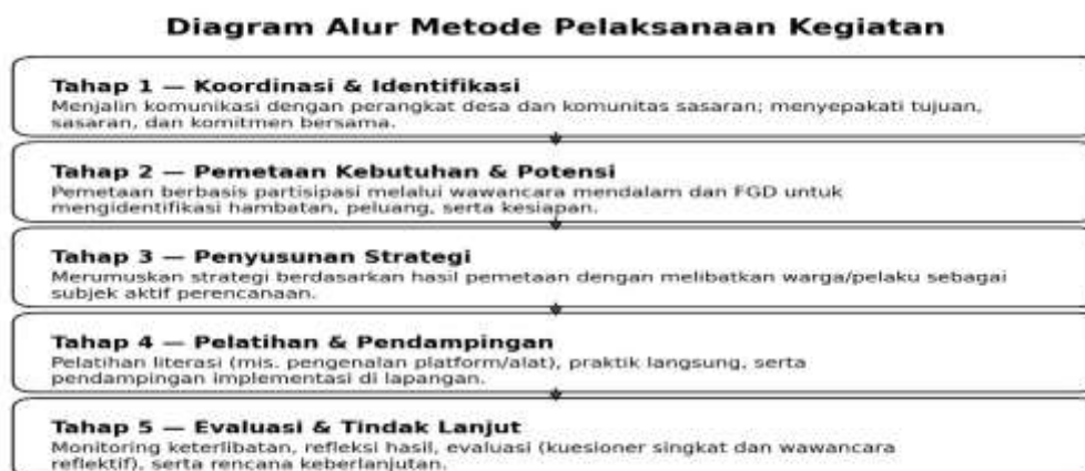
Gambar 1 Diagram Alur Metode Pelaksanaan Kegiatan

Transformasi kualitas hidup masyarakat desa tidak terjadi secara instan, melainkan melalui proses sosial yang melibatkan edukasi, kreativitas, dan aktivitas sosial berbasis komunitas. Teori pemberdayaan masyarakat menempatkan warga sebagai subjek aktif perubahan yang memiliki kapasitas untuk merefleksikan pengalaman, membangun kesadaran kritis, dan menciptakan perubahan bermakna