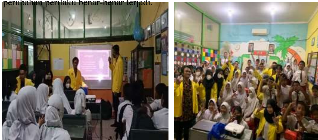
Gambar 2. Sosialisasi dampak penggunaan gadget bagi siswa SD Menganti Permai

Namun, efektivitas ini sangat tergantung konsistensi. Bila orang tua dan guru tidak konsisten dalam menerapkan aturan misalnya terkadang memberi pengecualian maka anak cenderung kembali ke pola lama. Ini menunjukkan bahwa sosialisasi dan pengawasan perlu diimbangi dengan komitmen jangka panjang agar perubahan perilaku benar-benar terjadi.