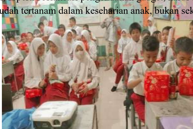
Gambar 1. Siswa Sekolah Dasar Menganti Permai

Dengan demikian, dapat disimpulkan bahwa tingkat penggunaan gadget di kalangan siswa SD cukup tinggi, dan kecenderungan penggunaan lebih untuk hiburan daripada edukasi. Kondisi ini menegaskan bahwa dalam konteks penelitian ini, gadget sudah menjadi bagian dari keseharian siswa yang memberikan dasar kuat untuk analisis dampak terhadap perilaku dan interaksi sosial mereka. Temuan ini menyediakan landasan empiris bahwa dalam setting sekolah dasar, gadget bukan lagi barang “sesekali” tetapi bagian dari rutinitas sehari-hari siswa. Oleh karena itu setiap intervensi, seperti sosialisasi pengendalian gadget, harus mempertimbangkan bahwa gadget sudah tertanam dalam keseharian anak, bukan sekedar alat tambahan.