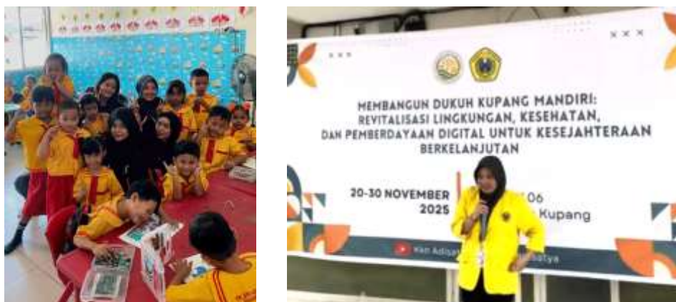
Gambar 1: Kegiatan Sosialisasi

meliputi pengenalan bahan dan alat, tahapan pengolahan minyak jelantah, proses pembuatan lilin, serta aspek kebersihan dan keamanan produk. Hasil dari kegiatan ini menunjukkan bahwa masyarakat memperoleh pengetahuan baru mengenai pengelolaan limbah minyak jelantah dan peluang pengembangannya sebagai produk kerajinan sederhana. Selain mengurangi pencemaran lingkungan, kegiatan ini berpotensi menjadi alternatif usaha rumahan yang dapat mendukung peningkatan pendapatan masyarakat.