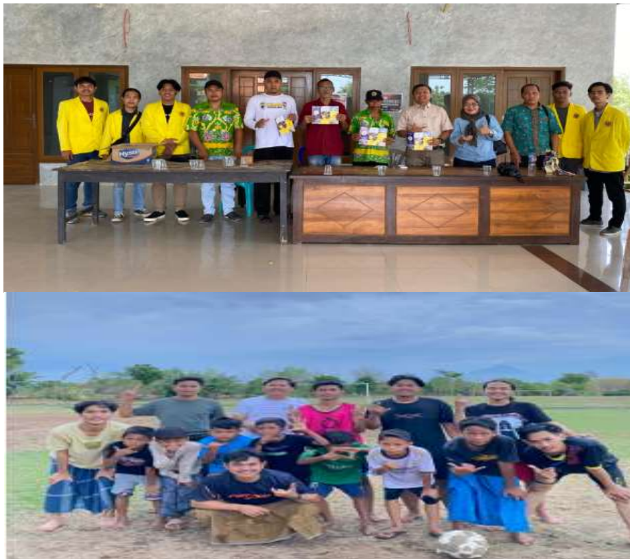
Keterangan: Saat Mahasiwa Ubhara KKN Di Desa Kalisat

Program ini merupakan tindak lanjut dari program KKN dimana diperlukan adanya pemberdayaan remaja terkait pencegahan kenakalan di kalangan remaja; karena pemerintah desa merasa perlu untuk menjaga ketertiban dan keamanannya dengan memberdayakan kelompok remaja yang tergabung dalam Karang Taruna agar siap menghadapi perubahan social ekonomi yang semula hanya agraris menjadi wilayah pariwisata sehingga tidak terjebak dalam kenakalan remaja yang tidak hanya merugikan dirinya akan tetapi dapat mengganggu ketertiban umum. Berbagai kenakalan remaja seperti seperti berkelahi, membuat masalah, mengganggu temannya juga disebabkan oleh keluarga dan lingkungan sekitar. Mencegah perilaku remaja berupa kenakalan ini memerlukan adanya evaluasi pada program sekolah serta upaya kolaboratif antara pihak sekolah dan keluarga. Untuk mengatasi masala kenakalan remaja diperlukan pendekatan dan metode yang tepat harus didasarkan pada pemahaman yang komprehensif dari sebab-sebabab kenakalan remaja dan Solusinya jika itu terjadi adanya kenakalan remaja baik secara preventif maupun kuratif.(3)