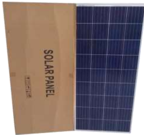
Gambar 2. Panel Surya Figure 2. Solar Panel

Panel surya yang digunakan dalam kegiatan ini merupakan panel merek Sunasia dengan kapasitas masing-masing 120 watt-peak (Wp), sebanyak dua unit, sehingga total daya yang dihasilkan mencapai 240 Wp. Panel ini digunakan sebagai sumber energi utama untuk mengoperasikan aerator pada kolam lele. Konfigurasi sistem dirancang agar dapat menyuplai kebutuhan listrik untuk empat kolam terpal skala rumah tangga. Daya dari panel disalurkan melalui charge controller ke baterai 12 volt, yang kemudian digunakan untuk menyalakan aerator secara berkelanjutan, terutama pada siang hari saat intensitas cahaya matahari maksimal. Pemilihan panel surya ini dilakukan karena efisien, ramah lingkungan, dan dapat dioperasikan secara mandiri oleh masyarakat tanpa ketergantungan pada jaringan listrik PLN.