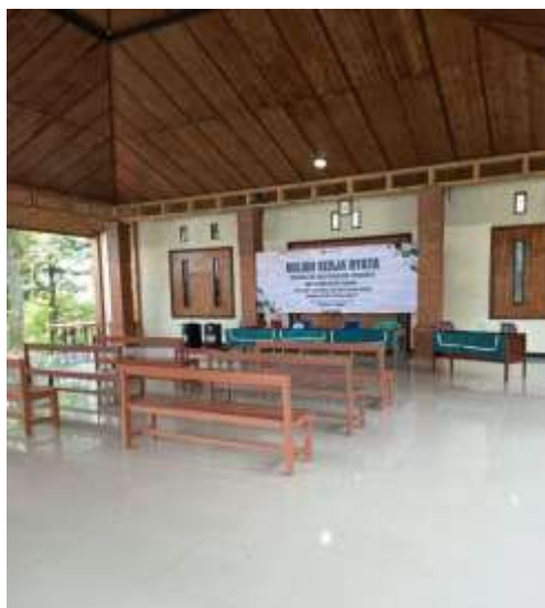
Gambar 1. Balai Desa Dusun Bulak Kunci Figure 1. Nogosari Hamlet Village Hall