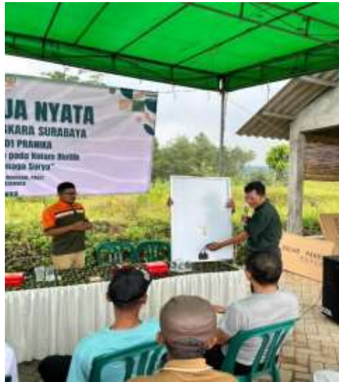
Gambar 3. Sosialisasi Energi Surya Ke Warga Figure 3. Solar Energy Socialization to Residents