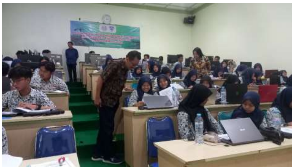
Gambar 4. Pembahasan Soal Post-test

penyampaiannya tidak memerlukan waktu yang terlalu panjang karena hanya merupakan kelanjutan dari materi pada sesi 1. Seperti pada sesi sebelumnya, sesi ini juga diakhiri dengan tanya jawab antara peserta dan pemateri. Selanjutnya peserta diberikan soal posttest untuk mengetahui perbedaan penguasaan materi antara sebelum dan sesudah pelatihan. Waktu untuk mengerjakan post-test adalah 15 menit. Kemudian setelah semua peserta menyelesaikan post-test dan mengumpulkan lembar jawaban, dilakukan pembahasan soal di kelas. Pembahasan dilakukan secara singkat karena peserta sudah kelihatan menguasai materi pelatihan dengan baik.