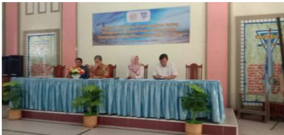
Gambar 1. Sambutan pada Pembukaan Acara PKM

Pembukaan acara PKM dilaksanakan di Aula Besar SMKN2 Surabaya dengan Pembawa Acara dari pihak sekolah. Kata sambutan diberikan oleh Wakil Kepala Sekolah SMKN 2 Surabaya dan dilanjutkan dengan sambutan dari Koordinator Program Studi S1 Teknik Sipil Unesa. Sambutan dari pihak sekolah sekaligus membuka acara pelaksanaan PKM tahun 2023 di SMKN 2 Surabaya.