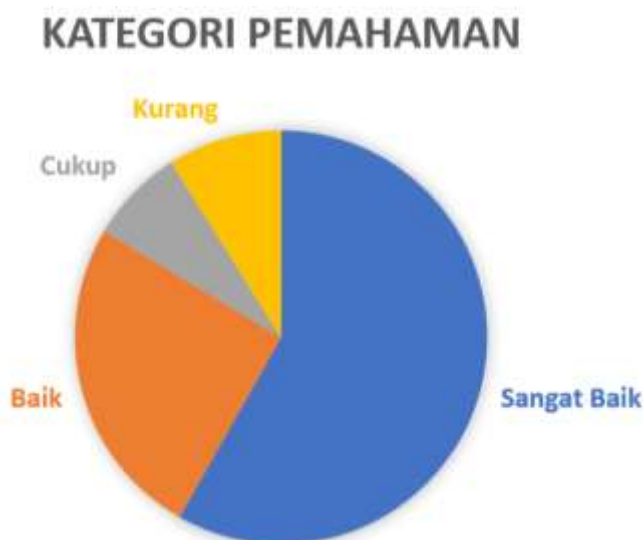
Gambar 6. Pemahaman Siswa terhadap Aplikasi SAP2000 untuk Mektex

Gambar dan tabel di atas menunjukkan pemahaman siswa terhadap aplikasi SAP2000 untuk menyelesaikan problem Mektex. Sejumlah 85,58% siswa bisa memahami materi pelatihan ini dengan baik menunjukkan bahwa pelatihan ini sangat efektif dalam meningkatkan kemampuan siswa untuk menyelesaikan problem Mekanika Teknik menggunakan aplikasi SAP2000 dan membawa manfaat yang besar sebagai bekal menghadapi tantangan dunia kerja pada saat ini.