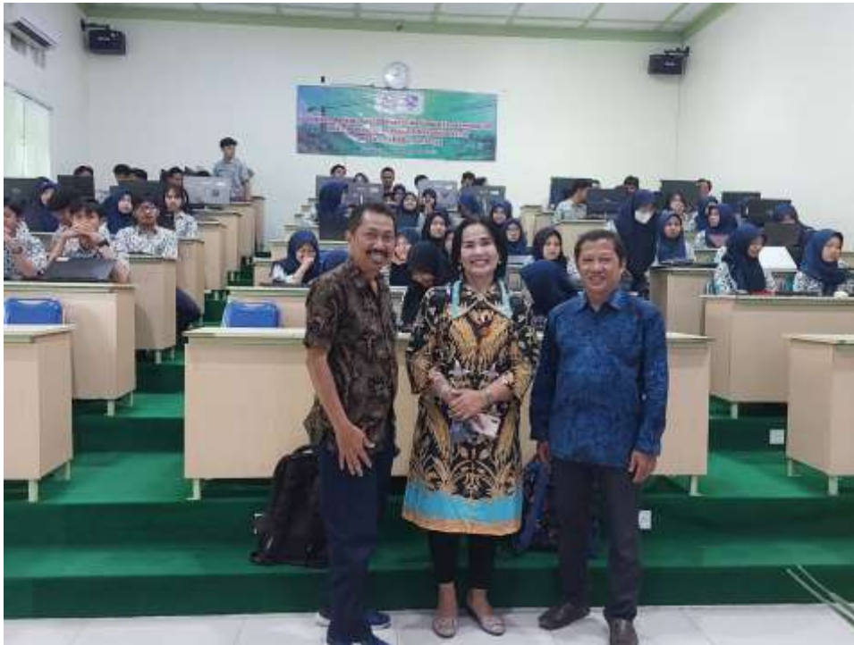
Gambar 2. Foto Bersama di Kelas Pelatihan

Pelatihan dimulai dengan memberikan soal pre-test kepada peserta yang dilaksanakan selama 15 menit, kemudian langsung dilanjutkan dengan pemberian materi sesuai dengan modul pelatihan yang sudah dibagikan kepada seluruh peserta. Pada saat pemberian materi diselingi dengan pembahasan soal pre-test yang sudah dilaksanakan sebelumnya. Di akhir pemberian materi sesi 1 dilakukan tanya jawab. Di bagian ini peserta bertanya kepada pemateri tentang hal-hal yang kurang jelas.