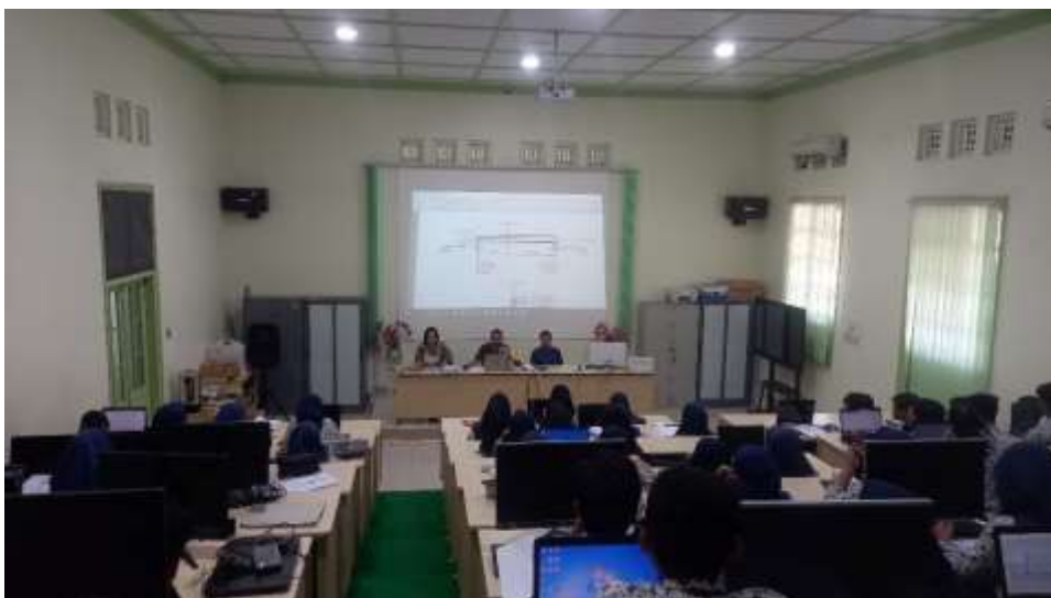
Gambar 3. Pemberian Materi di Kelas

Pelatihan dimulai dengan memberikan soal pre-test kepada peserta yang dilaksanakan selama 15 menit, kemudian langsung dilanjutkan dengan pemberian materi sesuai dengan modul pelatihan yang sudah dibagikan kepada seluruh peserta. Pada saat pemberian materi diselingi dengan pembahasan soal pre-test yang sudah dilaksanakan sebelumnya. Di akhir pemberian materi sesi 1 dilakukan tanya jawab. Di bagian ini peserta bertanya kepada pemateri tentang hal-hal yang kurang jelas.